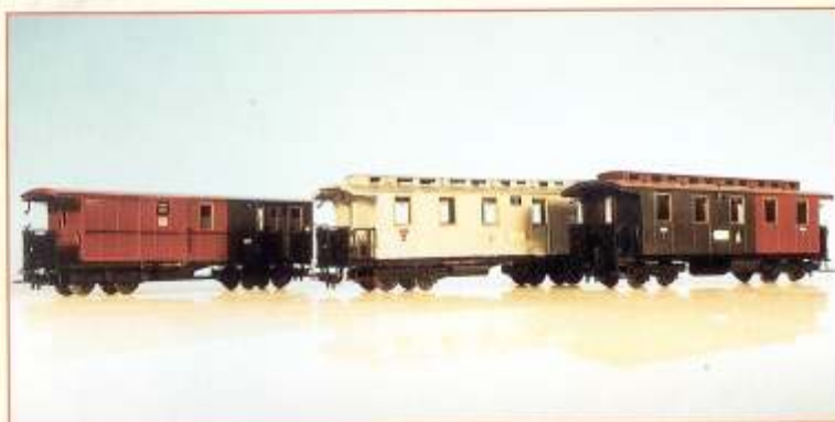
Foto: Wagen in KPEV Lackierung